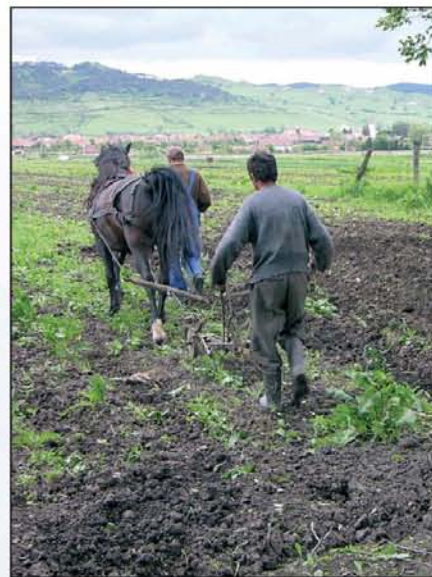
Szántás a volt csatatér közelében