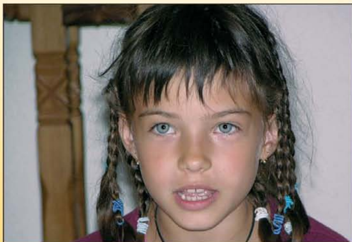
Istennek vele is terve van. A konferencián sok gyermek és fiatal résztvevő is volt.