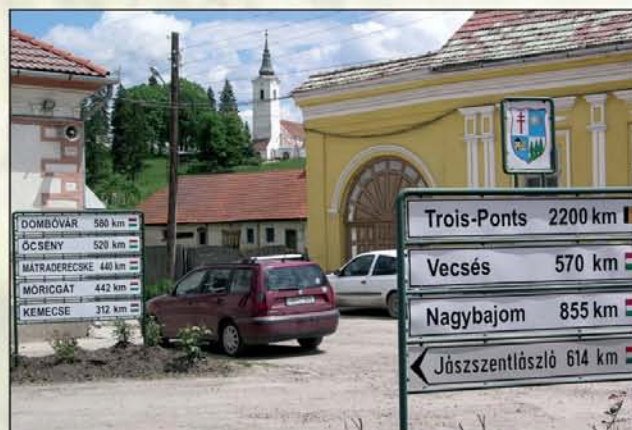
Ők ennyire számoltartanak minket...