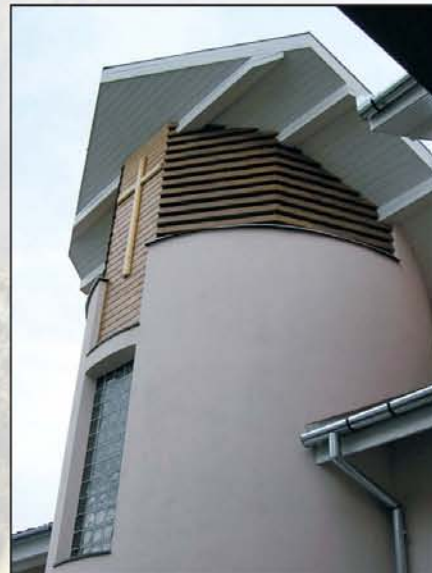
A nagy csíkszeredai katolikus tengerben él kétszáz evangélikus. Számukra épül a templom. Reméljük, lesz idén szentelés.