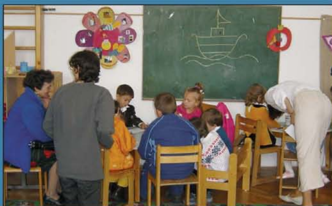
Gyermekfoglalkozás az egyházközség óvodájában