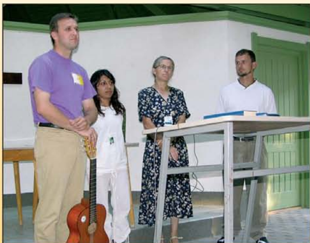
A kárpátaljaiak szolgálatán most is érezhető volt a Lélek kente. Isten hozta őket közénk.